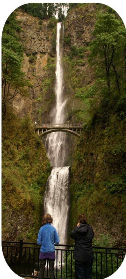
Multnomah Falls, Oregon

Garmin (gps'en) havde ikke umiddelbart noget bud på en campingplads, så vi var glade, da vi ved 8-tiden så et skilt om en plads i Tygh Valley. Den var billig, og ok, og lå i et område, hvor der jævnligt blev afholdt rodeo-opvisning.