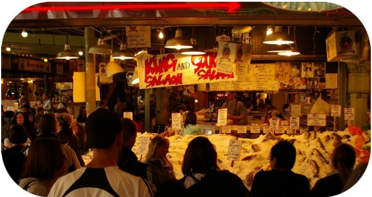
Pike Place Fishmarket (Seattle)

Derefter gik vi langs markedet, hvor vi så fine lava-figurer og meget smukke blomsterbuketter. Nu satte vi kursen mod en busholdeplads, da vi skulle med bus 510 mod Everett, da vi i denne by skulle hente vores camper. Vi blev sat af på Everett Syd, men herfra var der stadig et stykke til American Cruise, så vi fik en pige, som var ansat ved busselskabet og tilfældigvis også ventede en fest til at hjælpe os med at ringe efter en gul taxa. Taxaen kom hurtigt og vi kom godt hen til Cruise America ved 12.30 tiden for 13 dollar.