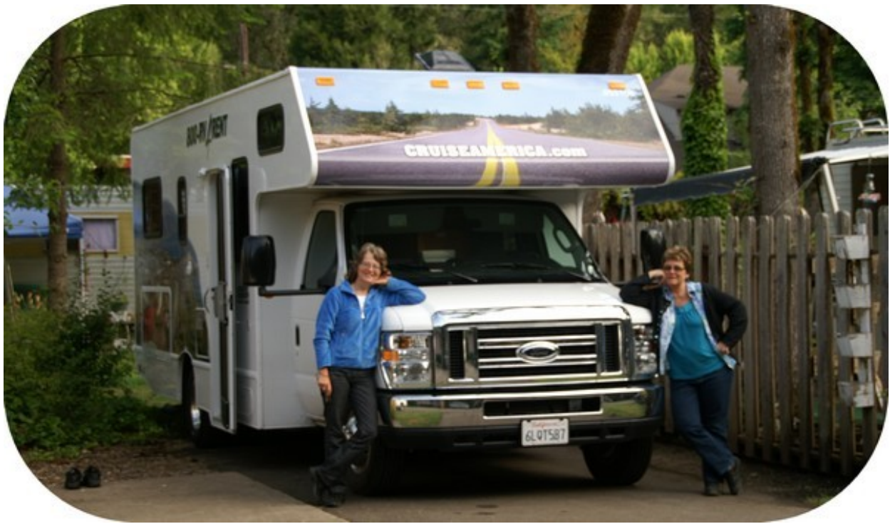
Vores "trucker" camper her med flere kølerfigurer.